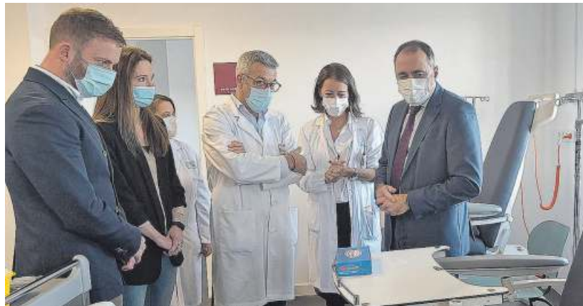
Unidad de ensayos clínicos. El conselleiro de Sanidade, Julio García Comesaña, visitó ayer el materno con motivo de la puesta en marcha de una unidad de ensayos clínicos, que permitirá evaluar la efectividad de nuevos fármacos. «É un punto de inflexión no marco da investigación sanitaria», aseguró. De hecho, en el servicio de Oncología hay 160 casos clínicos activos y, con esta ampliación (300 metros cuadrados más), se podrán incluir en el 2023 otros 30 pacientes en estadios precoces de la enfermedad.

Ese convenio se llevará hoy a aprobación en una sesión extraordinaria y urgente del pleno de A Coruña. «Se ese convenio vai co compromiso orzamentario que é o que ten que ir, seguro que non hai ningún problema. E unha vez estea asinado nós daremos o paso seguinte que é licitar as obras. Creo que todos, e o Concello tamén, estamos aliñados para comezar as obras canto antes», indicó. En cuanto a las dificultades de A Coruña para incluir ese compromiso presupuestario en el convenio sin tener todavía aprobadas las cuentas municipales para el 2023, el conselleiro indicó que está seguro de que el Ayuntamiento coruñés «é consciente da importancia deste proxecto e dará os pasos necesarios para que se poida comezar e que toda esta cadea de etapas que temos por diante poida fa-