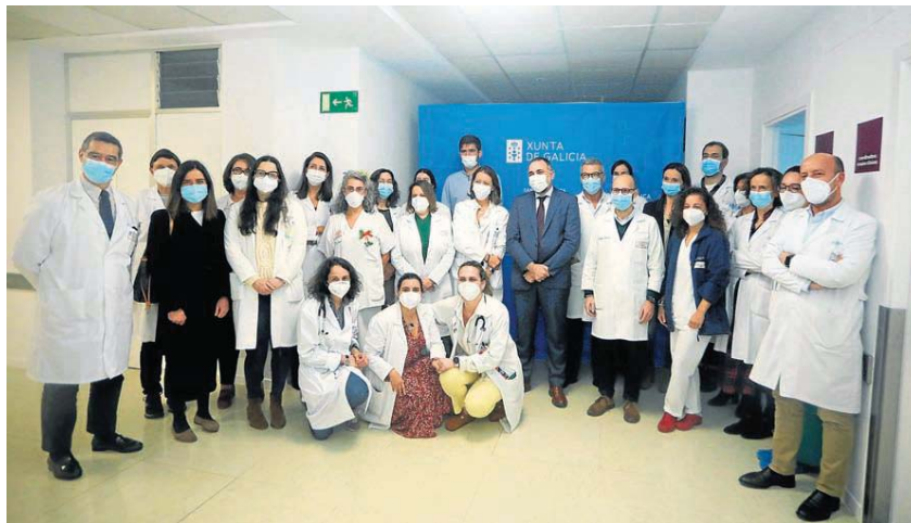
El conselleiro visitó las nuevas instalaciones y conversó con el equipo

“Contades –continuó– con persoal altamente cualificado, capaz de ofrecer os tratamentos máis novedosos, nunhas instalacións multidisciplinares e adaptadas, que favorecen unha atención de calidade aos pacientes”, y que ahora se adecuaron para disponer de un espacio de más de 300 metros cuadrados, con recepción propia, sala de descanso