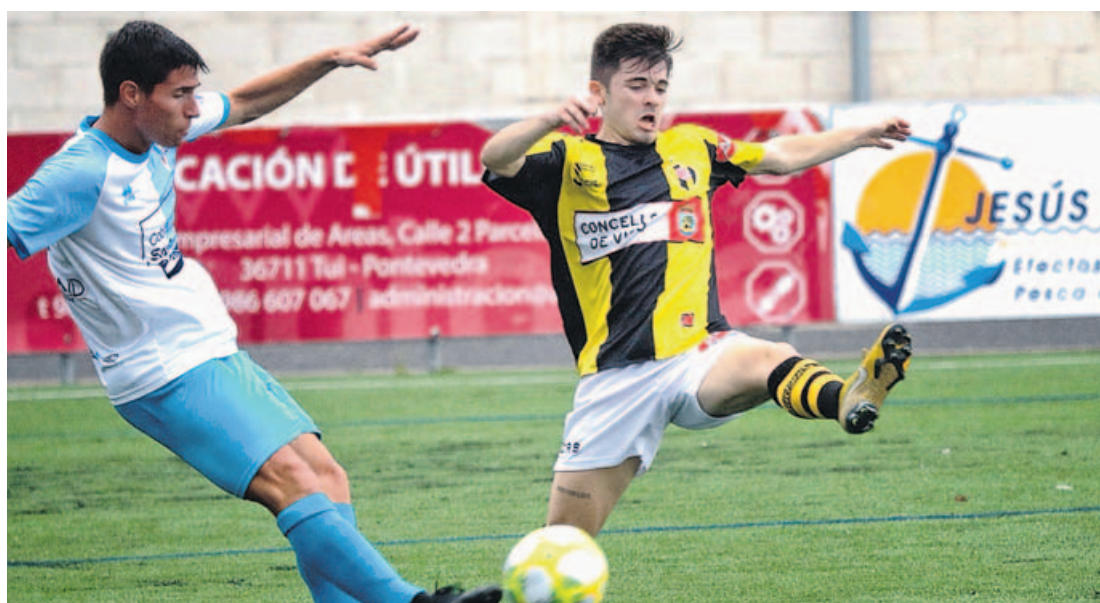
El Compos, que jugó toda la segunda parte con uno más, fue muy superior al Rápido de Bouzas en su visita a Vigo. ÓSCAR VÁZQUEZ

Abel Caballero sostiene que en Galicia ya no habrá mayoría absoluta 2 y 3