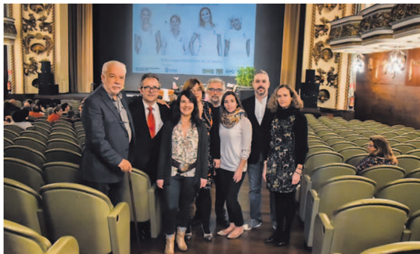
Los especialistas sanitarios que participaron en el foro, momentos antes del inicio.

No olvidó tampoco apuntar lo distinto que es afrontar la enfer-