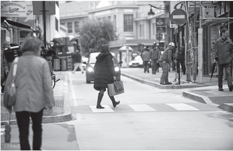
En algunos pasos de peatones de la zona han estado a punto de registrarse atropellos