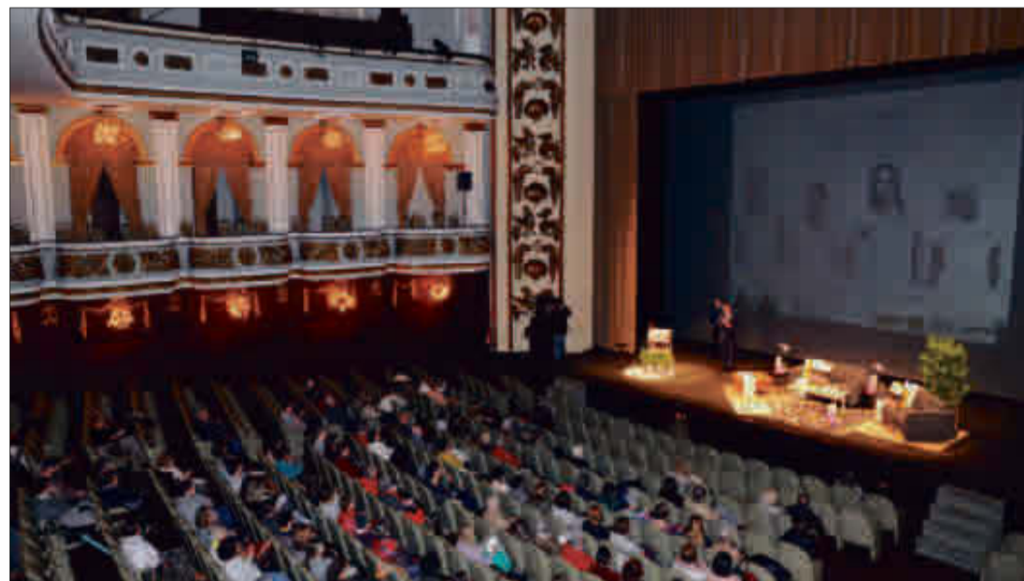
Asistentes al ciclo, ayer, en el Teatro Colón de A Coruña.

sión, la ansiedad o los cuidados específicos de las zonas afectadas tras padecer esta patología que ya representa uno de cada tres tumores diagnosticados en mujeres. Di-