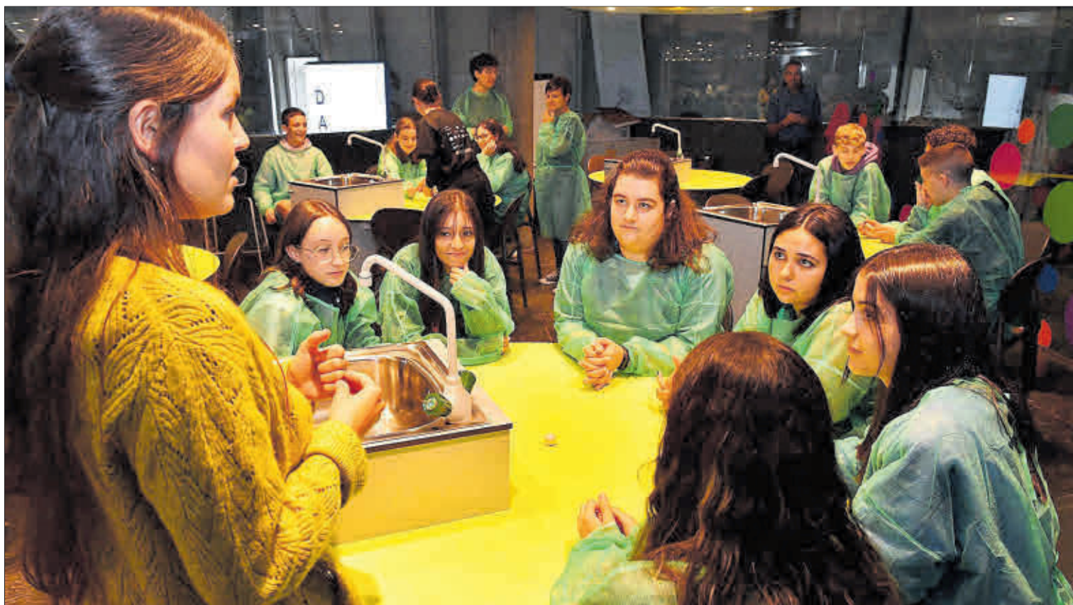
Estudiantes de Bachillerato atienden una charla en la Domus.

de la tecnología y cómo ayuda a la sociedad. Participaron alumnos de Bachillerato del Rafael Dieste, Monelos y Alfonso X O Sabio de Cambre