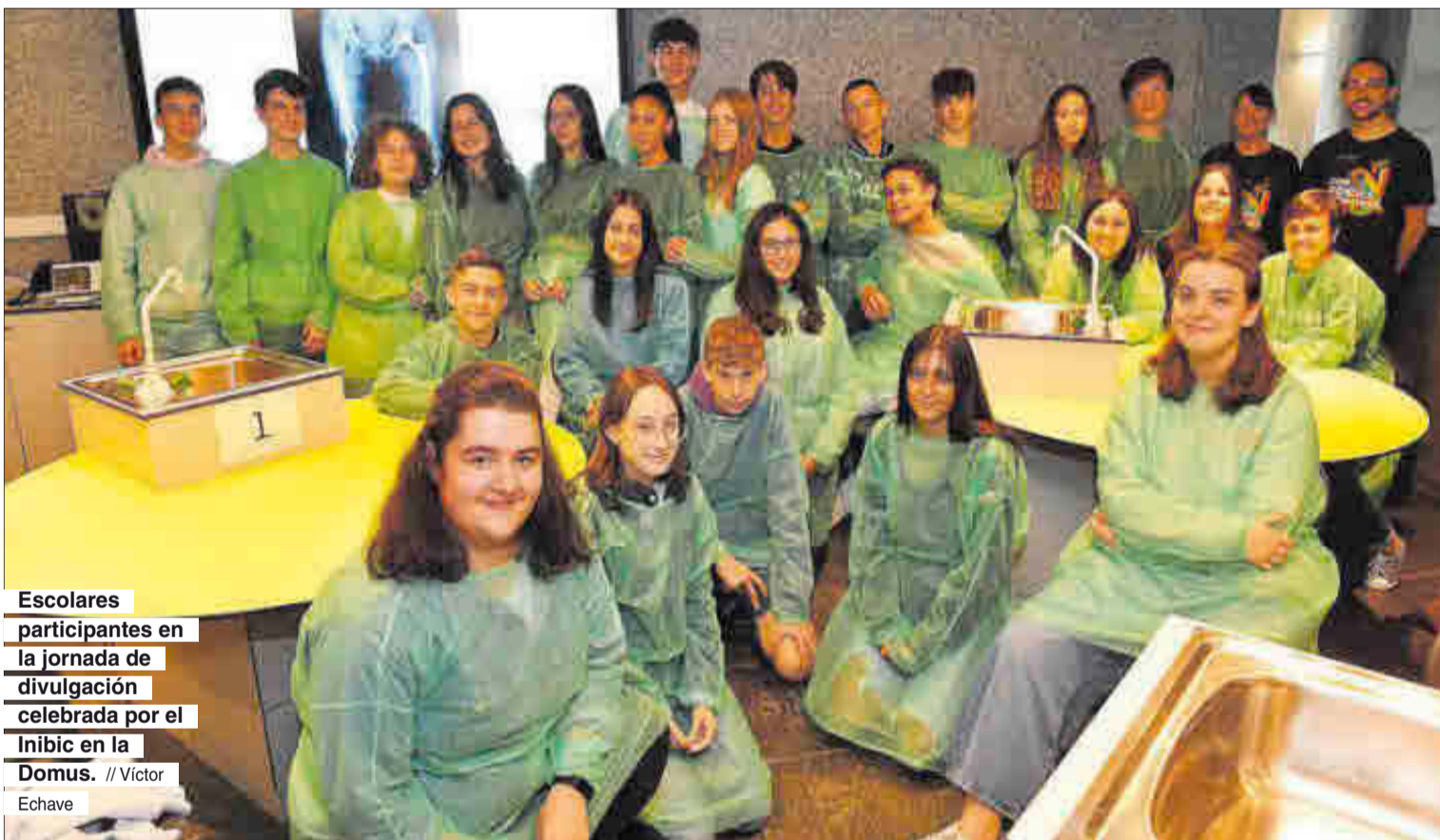
Escolares participantes en la jornada de divulgación celebrada por el Inibic en la Domus.