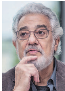
El tenor español.

«Por supuesto, las denuncias anónimas no son tolerables en una justicia democrática», recuerda Asúa. «Ni se puede dar por bueno algo que no esté mínimamente documentado», añade. Desde el punto de vista penal, además, algo ocurrido hace